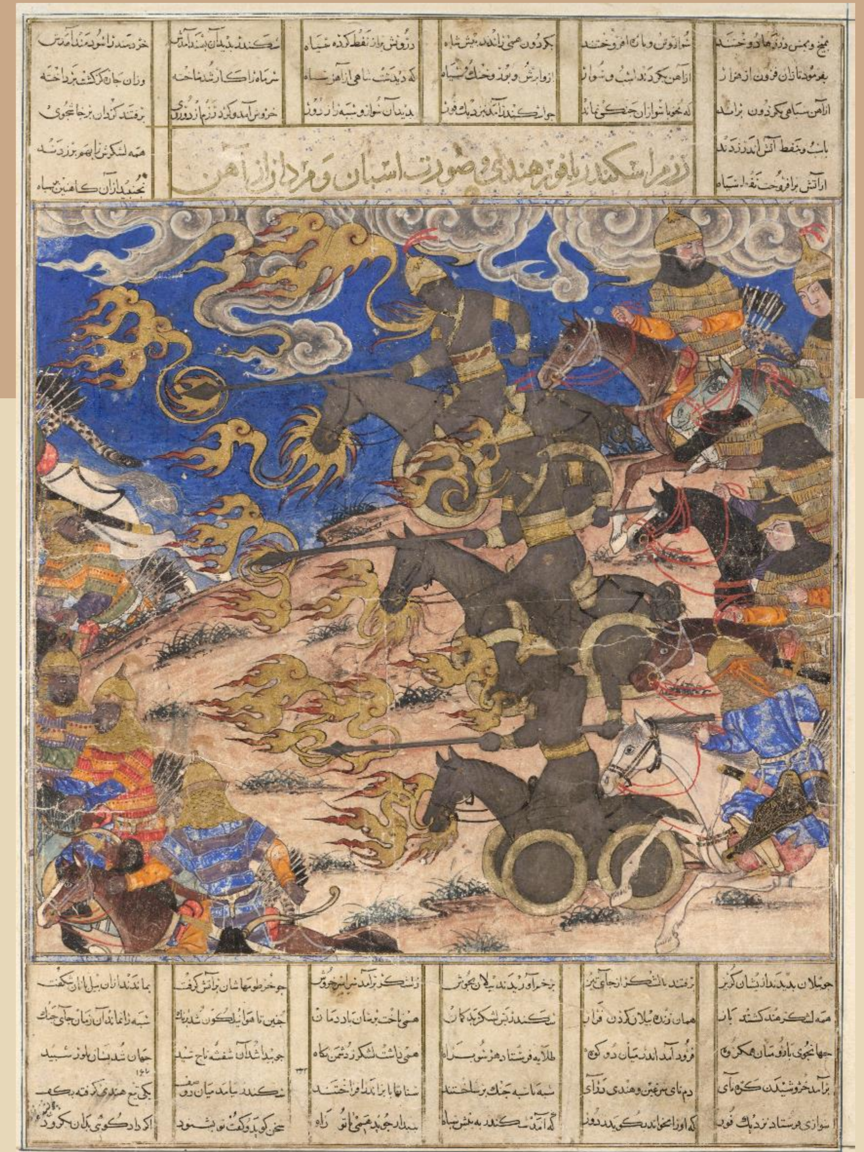
شاهنامه ابوسعیدی (دموت)